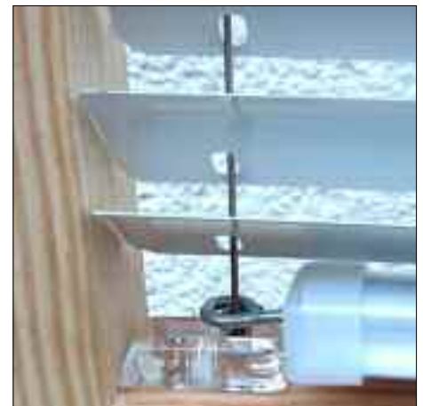
... und Seitenführung