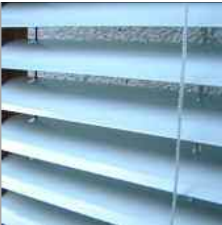
dim-out Stanzungen für Zugschnur...

Stanzungen für Zugschnur und Seitenführung (optional) am hinteren Rand der Lamellen.