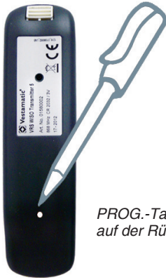
PROG.-Taste auf der Rückseite

Drücken und halten Sie die „STOPP-Taste“ (mittlere Taste) für 3 Sek. bis die LEDs blinken. „STOPP-Taste“ loslassen und mit Hilfe der Taste EIN/AUF ▲ oder AUS/AB ▼ den Kanal wählen und mit der „STOPP-Taste“ bestätigen.